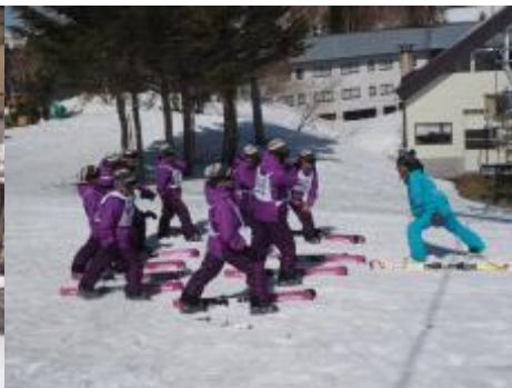
実習Ⅱの開始もストレッチでほぐしてから