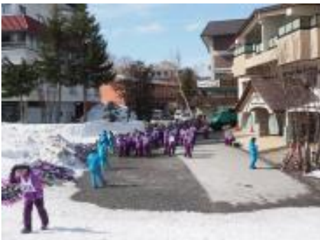
ホテルの並びとゲレンデの境