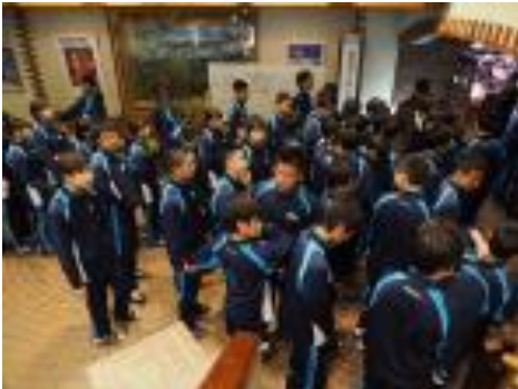
レストラン前での整列・点呼

今朝の志賀高原一の瀬、凜と冷えた空気に包まれ、晴れ渡る青空が山の上に広がっていました。ホテルで一晩過ごした生徒たちは嬉しい朝をすがすがしい気持ちで迎えました。昨日同様写真で活動報告をさせていただきます。