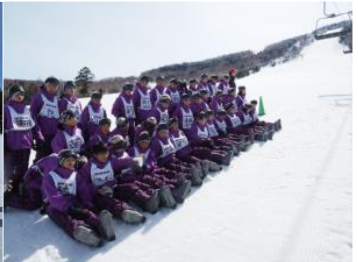
ゲレンデの裾で思い出のクラス写真を撮影