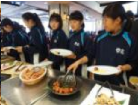
朝食ながらボリューム大