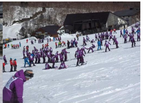
ゲレンデ下部は実習銀座の様相

昨夜は生徒たちの価値観として翌朝からのハードなスキー実習などに備えるための睡眠の重視がはっきりとありました。消灯後にはすみやかに「睡眠態勢」に入っていました。そのことにより、本日の6時間もの実習が気持ちよくスタートできたのでした。そうした生徒たちへのプレゼントがすばらしい快晴と快適なゲレンデコンディションであったのでしょう。そして、どの生徒も意欲的にスキー技術の向上を目指してがんばっていました。