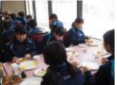
窓からの自然光で倍加される朝食の味