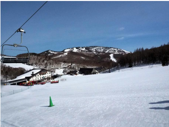
圧倒的な快晴・完璧なゲレンデ（奥の山は焼額山）