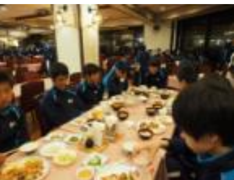
ゴージャスかつ楽しくご馳走を食べる