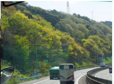
緑あふれる往路の光景