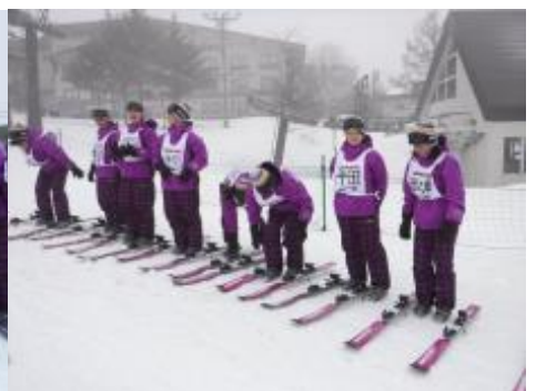
きれいに並んでレクチャーを受ける