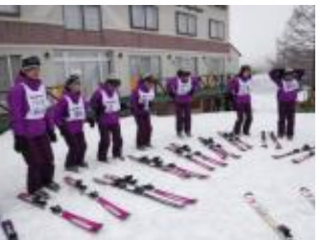
ついにゲレンデへ出での実習開始