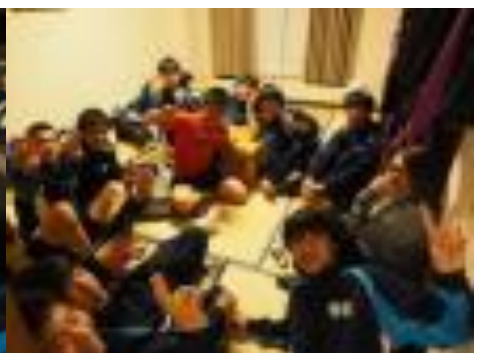
インストラクターさんとのミーティング

実行委員の皆さんの長きにわたる諸準備があって、この日がありました。初日、いくつかの場面で実行委員への協調性が試される場面がありました。また時間が圧縮される中で室長や班長まかせにしない「主体性」も多面的に求められました。初日のみんなの課題、それらが2日目にどう生かされ深められるか期待されるところです。