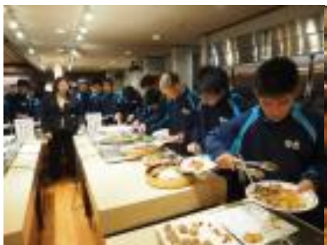
カフェテリアから自分の皿に取り分ける