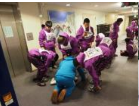
ブーツ履きで汗だくに