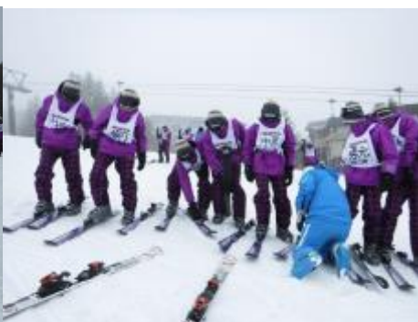
インストラクターさんの献身的指導