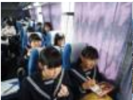
雨が降り車内で昼食