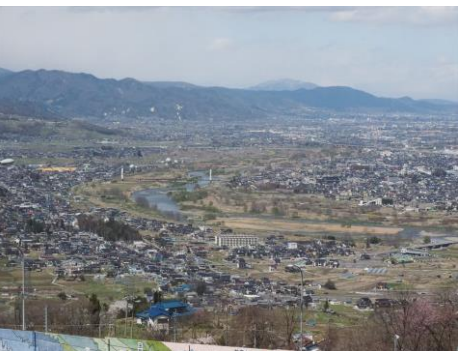
姥捨サービスエリアからの絶景