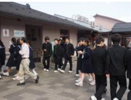
多賀サービスエリア